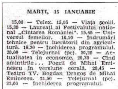
Fig. 3 – Programul TV de marți, 15 ianuarie 1985, tipărit vineri, 11 ianuarie 1985