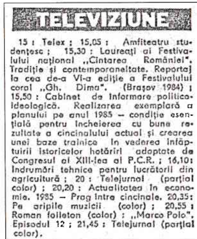
Fig. 2 – Programul TV de marți, 8 ianuarie 1985. Doar TVR 1, pentru că TVR 2 emitea doar în weekend