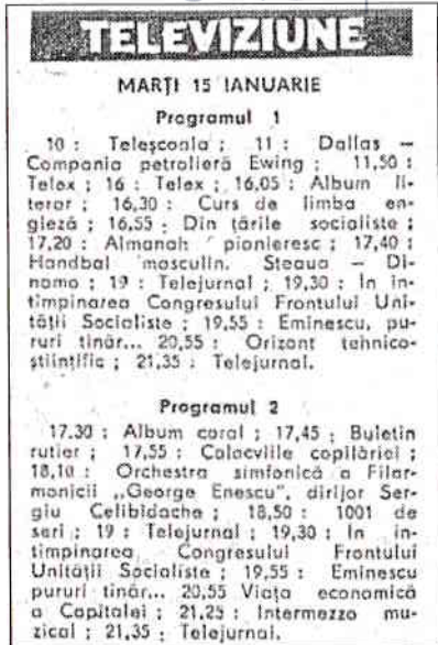
Fig. 1 – Programul TV de marți, 15 ianuarie 1980, posturile TVR 1 și TVR 2